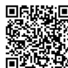
大会 WEB 掲示板